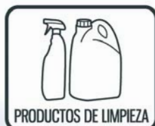
PRODUCTOS DE LIMPIEZA