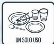
UN SOLO USO