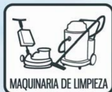
MAQUINARIA DE LIMPIEZA