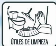
ÚTILES DE LIMPIEZA